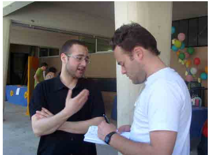
Réda El Wady en entretien avec un journaliste le 31 Mai 2009

DIMANCHE 30 MAI 2010 PLACE DUPLEIX - PARIS XV