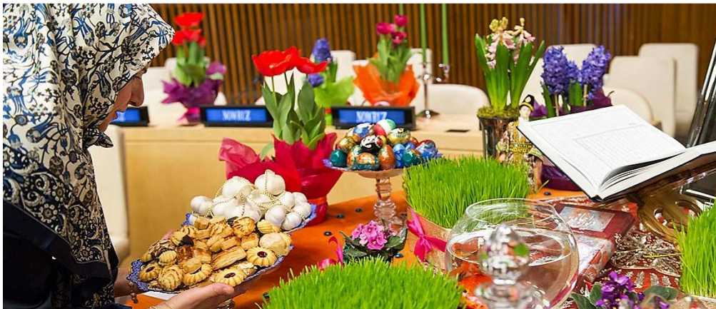
Un “buffet”, appelé “Haft-Sin”, organisé à l’occasion de de la célébration de Nowruz à l’O.N.U., à New York.

Photo ONU / Rick Bajornas. (Cette photo et sa légende sont tirées du site de l’O.N.U.)