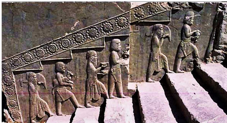
Les représentants des divers peuples de l'Empire Perse apportent des présents à l'Empereur pour la Fête de Now-Rúz (Persépolis).

Ce changement de date se fit sous le règne de l'Empereur perse CYRUS le Grand qui libéra les Enfants d'Israël du joug des Babyloniens et fut chargé par l'Éternel de faire reconstruire le Temple de Jérusalem. Cyrus [de religion zoroastrienne] a un rang important puisque non seulement il est connu comme le premier "promulgateur" d'une charte des Droits de l'Homme assurant notamment la liberté religieuse, mais surtout parce que, à 19 reprises, il est mentionné dans la BIBLE, parfois même sous le nom de : « le berger, l'oint de l'Éternel ». https://www.bible-notes.org/article-385-cyrus-berger-et-oint-de-l-eternel.html