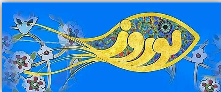
Calligraphie de Now-Rúz, en persan, sous la forme d'un poisson porte-bonheur.

Dans la Mythologie iranienne il est dit que le Dieu Suprême a créé l'Univers en six jours : successivement le ciel, la Terre, l'eau, les plantes, les animaux et, le sixième jour, l'Homme... Une fête célébrait le jour de chacune de ces créations : celle de l'apparition de l'Homme s'appelait "Now-Rúz".