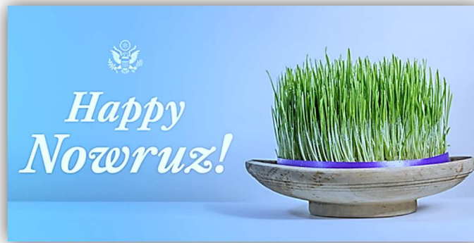
Image postée sur le site du Ministère américain des Affaires Étrangères, Washington (U.S.A.), Mars 2021.

Antony J. BLINKEN, Secretary of State, Nowruz message (20 March 2021) :