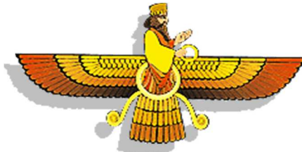
Le "Farvahr", symbole du Zoroastrisme.

Jusqu'à l'An 538 avant Jésus-Christ, Now-Rúz n'était que la Fête de la Création (de l'Homme). À partir de cette date, les Iraniens font coïncider le jour du Nouvel An (fêté jusque-là au début de l'Automne) avec cette fête célébrée le premier jour du Printemps.